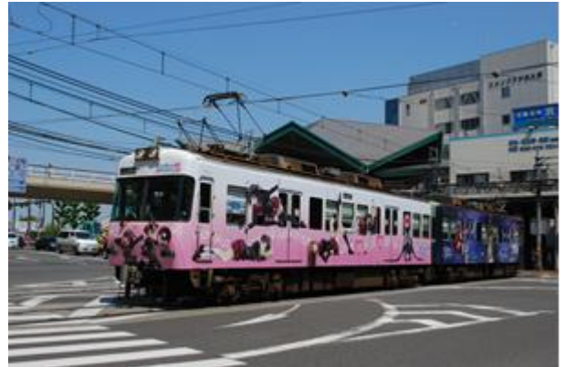
京阪電車石坂線「ラッピング電車」

京阪電車大津線は、京津線が大正元年 8 月 15 日に、石山坂本線が大正 2 年 3 月 1 日にそれぞれ開業し、今年で 102 周年を迎えます。最近では、平成 9 年 10 月 12 日の京都市地下鉄東西線開業に伴い、京津線の京津三条～御陵間を廃止し、京津線電車が東西線に直通運転を実施しています。京阪電車と大津線のこれまでの歴史を振り返り、現在における大津線の課題と活性化へのさまざまな取り組みについて紹介します。